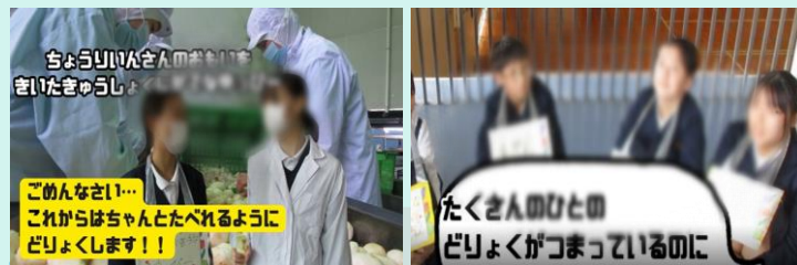
給食委員会【給食を通じた適切な栄養の摂り方】