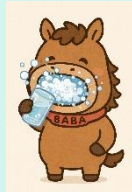
保健委員会【健康な歯を守る意識を高めるクイズ】