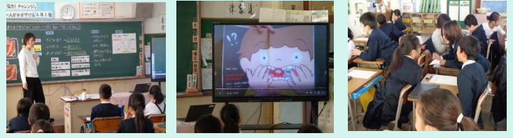
かむ回数と唾液の分泌との関係調べるための実験