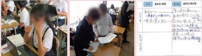
思考ツールを活用した課題の分析と目標の意思決定