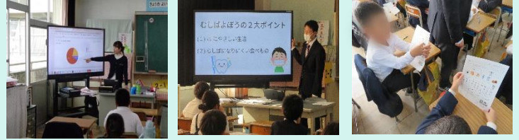
栄養教諭によるおやつのおいしく食べ方の指導