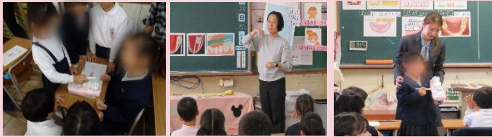
養護教諭による歯を守るための歯磨き指導