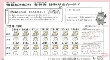
歯みがきキャラクターを活用した家庭での実践