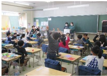
保健委員によるクラス訪問(クイズ出題)