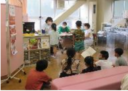
歯科衛生士による歯と口の健康チェック