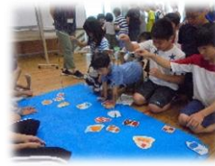
歯の染め出し 歯にいいおやつを釣り上げよう