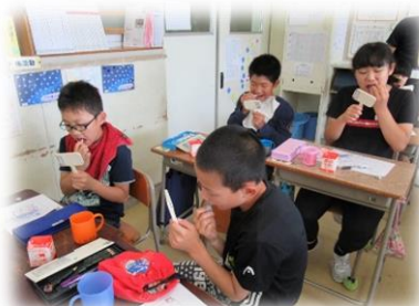
5年：健康な歯ぐきを保つためにどんなみがき方をすればよいか