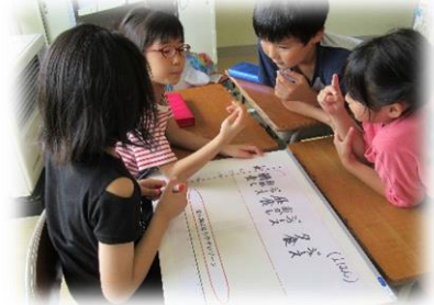
3年：むし歯になりにくいおやつを食べ方を考えよう