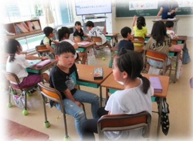
2年：はみがきのほかに、むしばをふせくほうほうってあるのかな