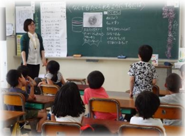
1年：なんでもたべられるようするには