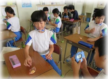
4年：よくかむための工夫を考えよう