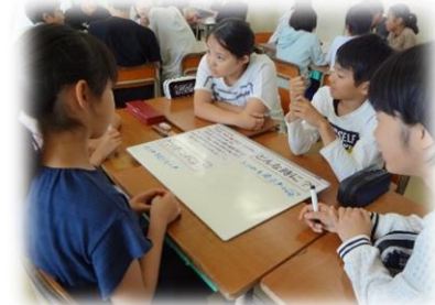
6年：歯や口をどうやってケガから守っていくのか