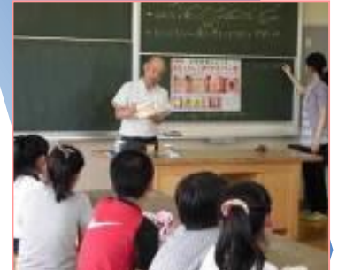
< (上) 学校歯科医による保健指導 >