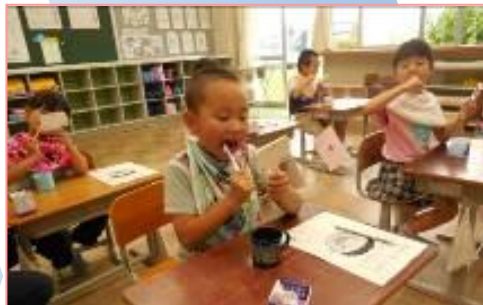
< (上) カラーテストを活用した学習 >