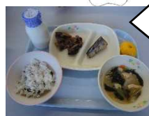
北っ子歯っくん元気メニュー