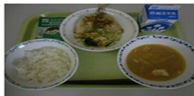
歯により献立「かみかみ給食」の実施