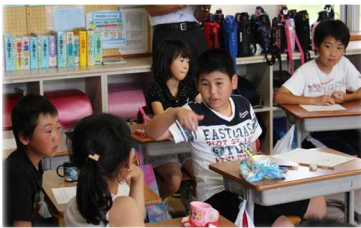
共通している課題を話し合う姿