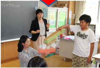
養護教諭とのTT指導