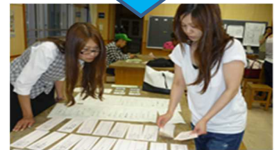
PTA厚生委員会によるむし歯予防標語コンクール