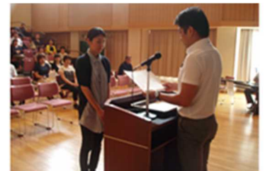
よい歯の標語・保護者の部表彰