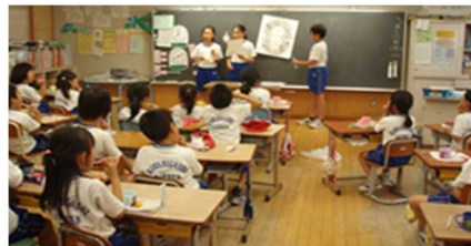
上学年・下学年の学び合い