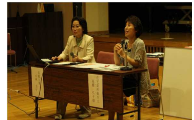
歯科衛生士による講演会の実施