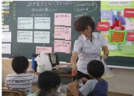
10月7日 3年1組 「よくかむといいこといっぱい」