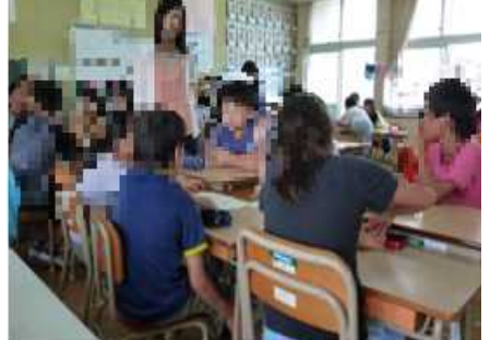
10月9日 5年2組 「健康な歯や歯肉をつくる仕事」