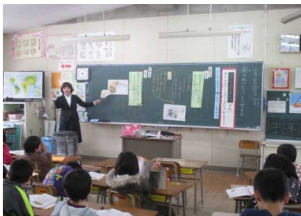
2月21日 1年1組 「歯がぬけたらどうするの」