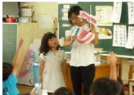
7月2日 1年2組 「6ちゃん王子をみがこう」