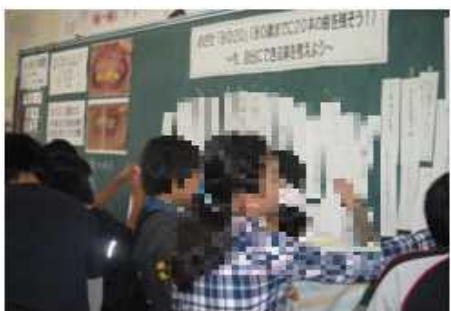
11月6日 6年2組 「めざせ8020」