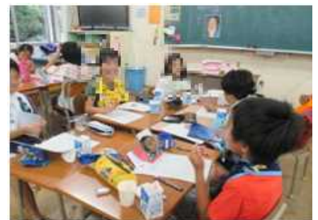
7月3日 4年2組 「自分に合った歯のみがき方を考えよう」