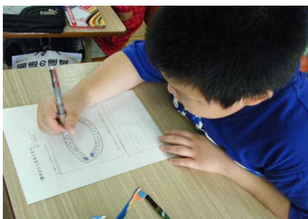
7月3日 6年1組 「みがき残しをなくそう」