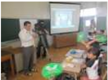
4年・学童歯みがき大会参加