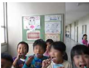
お昼の歯みがきタイム（全学年）