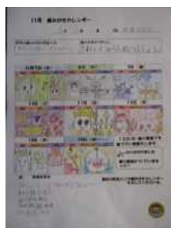
歯みがきカレンダーで 毎日の歯みがきのチェック