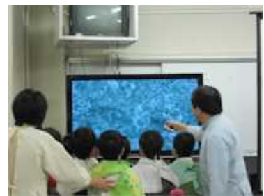
3年・むし歯のメカニズム