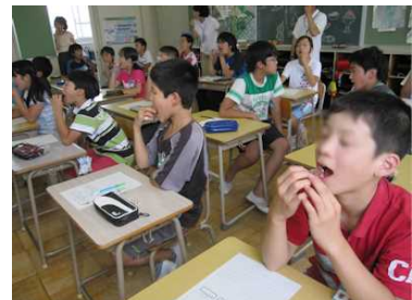
6年・しっかりとかんで食べよう