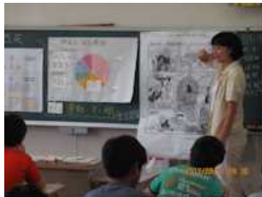
5年・歯と健康の関わり