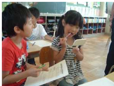
2年・歯みがき名人になろう