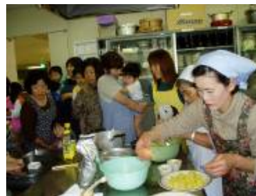
<おやつ対策の取り組み>