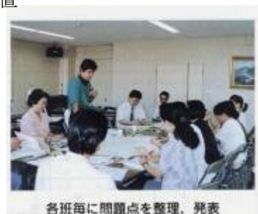
各班毎に問題点を整理、発表

3歳児のむし歯がとても多いことをはじめ、大蔵村の現状と課題の把握を行い、みんなの力で改善していくことを確認し、目標値を設定した。