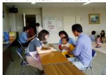
<幼児の歯科検診と保健指導>