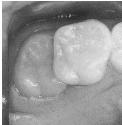
写真1 上顎第一大臼歯の異所萌出

過剰歯の発現頻度は数%であり、その殆どは上顎前歯部、特に正中部にみられます。そのうち約8割が埋伏状態であり、そのさらにおよそ7割は逆生です。過剰歯は永久歯の歯根吸収や萌出遅延、嚢胞の形成、歯列不正などの障害を引き起こすことがありますが、線写真で偶然発見されることが多いことから、就学時の健康診断で問題になるのは萌出しているものに限られます。正中離開や叢生などの歯列不正の原因となるので、歯科医を受診するように勧めてください。