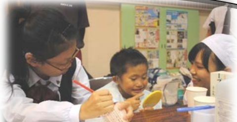
校内歯みがき大会 ～幼稚園から高等部まで在籍している 本校の特性を生かした取組～