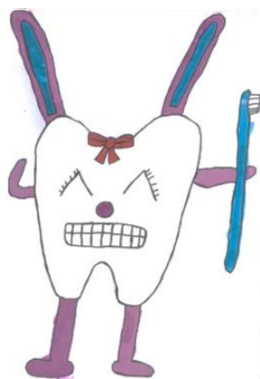
歯齶プロジェクトキャラクター 「ウサハ」