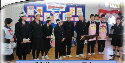
手作りエプロンシアター ～教科(家庭科)との連携～