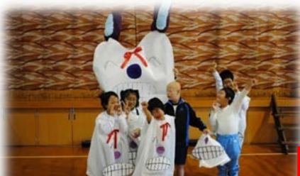
校内歯みがき大会 ～ウサハと一緒に～