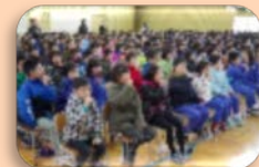
全校で上手な歯みがき