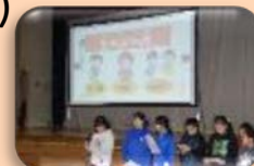
保健委員会の発表

講演では、むし歯や歯肉炎の原因について・自分でできる予防(セ ルフケア)と歯医者さんでできる予防(プロケア)について・上手な 歯みがきの仕方について教えていただきました。