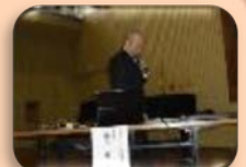
学校歯科医の講演